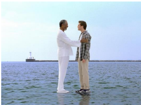
Fra Filmen "Bruce Almighty", USA 2003

Jeg holder meget af den film, der hedder "Bruce Almighty". Meget kort fortalt handler den om en person, der ikke synes han får nok hjælp af Gud og