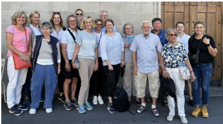
Deltagere i studieturen

Ulrich Zwingli, og herefter bevægede vi os ind i den smukke domkirke, der endnu bærer præg af den reformatoriske proces i 1500-tallet, idet al billedudsmykning fra den katolske periode dengang blev fjernet. Stenmurene står nøgne i al deres imponerende pragt.