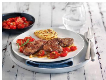
Kalvelever med rösti og tomater

Efter nu at have boet i Schweiz i snart 4 år kan jeg kun sige, at han tager fejl.