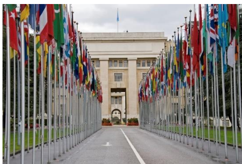
Flagindgangsalleen til FN i Genève

FNs og Røde Kors' betydning er også kommet tæt på i årene her i Schweiz, hvor vores verden har forandret sig over kort tid, og hvor betydningen af de to store spillere aldrig har været vigtigere. Krigens regler, det ved vi, bliver ikke overholdt, ligesom menneskerettighedernes ikke gør det, men de står naglefast! Og nogen kæmper hver dag for dem.