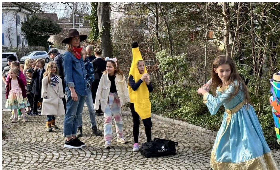
Fastelavn i Wallisellen 2023