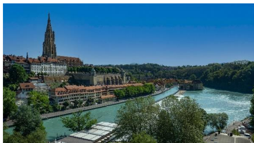
Berner Münster med Aarefloden i forgrunden

I Zürich er det først og fremmest kirken Fraumünsters herlige grundlæggelsehistorie og Chagalls glasmalerier i koret, som vil stå stærkt i erindringen, men slentreturene langs floden, hvor man fornemmer byens hurtige puls, er også så charmerende. - Men trafikken i og omkring Zürich er som helvedes forgård!